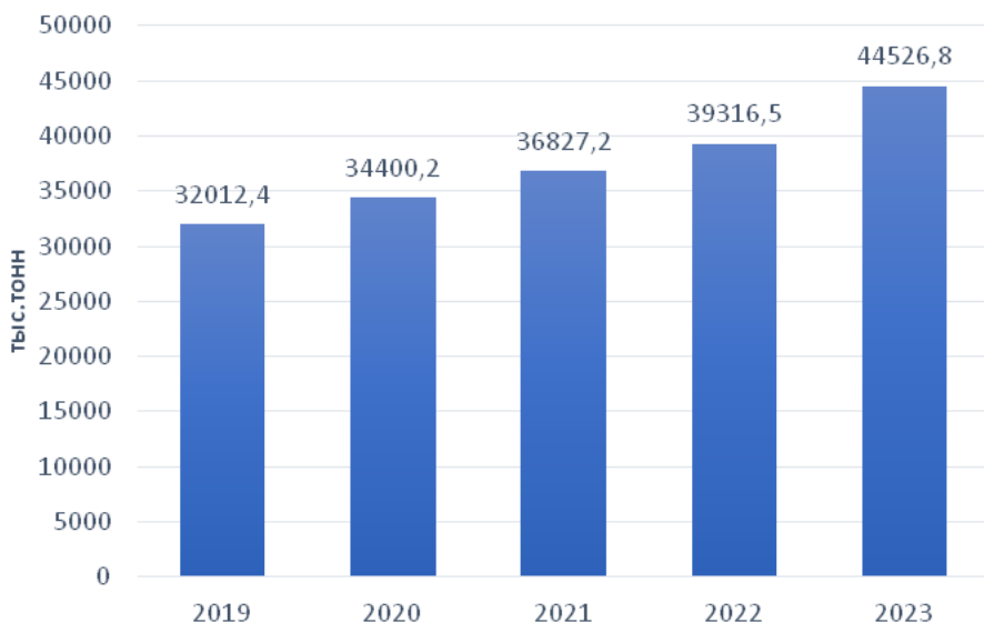
Рисунок 1. Производство сырого коровьего молока в Китае, 2019-2023 гг., тыс. тонн (1)

составили 6,1%. В среднесрочной перспективе прогнозируется дальнейшее увеличение объемов производства сырого молока.