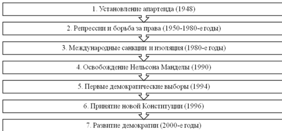
Рисунок 1. Этапы перехода от авторитаризма к демократизации в Южной Африке

Таким образом, процесс перехода Южной Африки от авторитаризма к демократии был длительным и сложным [4. С. 3].