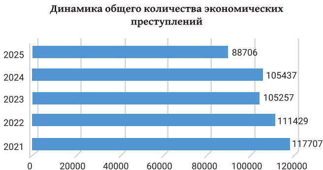
Диаграмма 2. Динамика общего количества экономических преступлений в РФ

Согласно сведениям Единой межведомственной информационно-статистической системы (ЕМИСС), с января по сентябрь 2025 года было выявлено уже 88706 преступлений (см.: Диаграмма 2) [11].